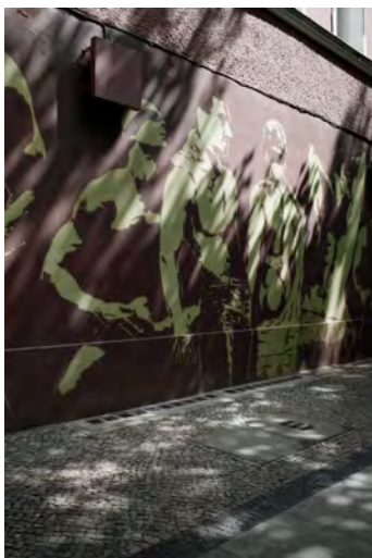
09 Ausstellungsparcours Peggy Buth (DE)

'Dancing On My Life', Werk-Photo von József R. Juhász, 2013