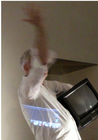
08 Ausstellungsparcours Bálint Szombathy (RS/HU)

'Dancing On My Life', Werk-Photo von József R. Juhász, 2013