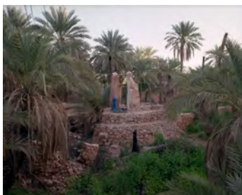
10 Ausstellungsparcours Kader Attia (FR)

Detailabbildung Connection Club, aus der Arbeit SUPERPARADISE, Peggy Buth, 2013 (Fotografie, Text)